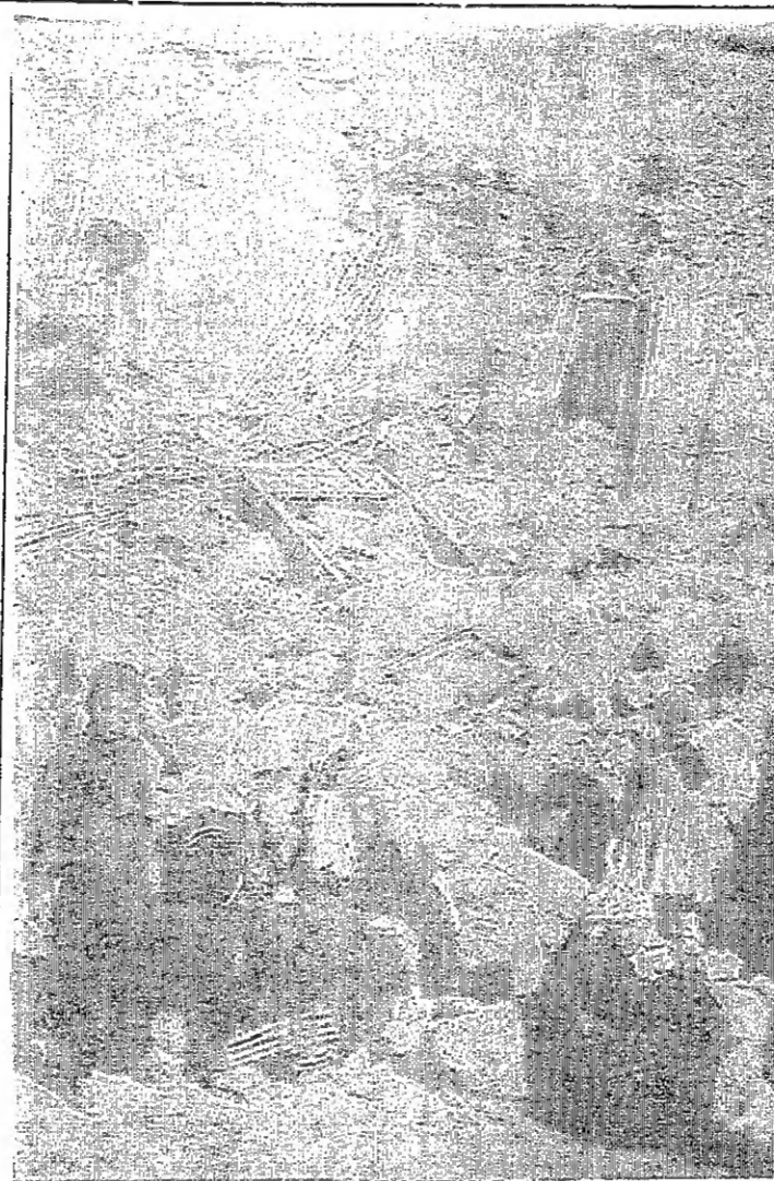
كثرت هذه منازل نزع بالحياة، حولها البرابرة الاسرائيليون الى اطلال وخرائب وشردوا الامان والامين من اهلها